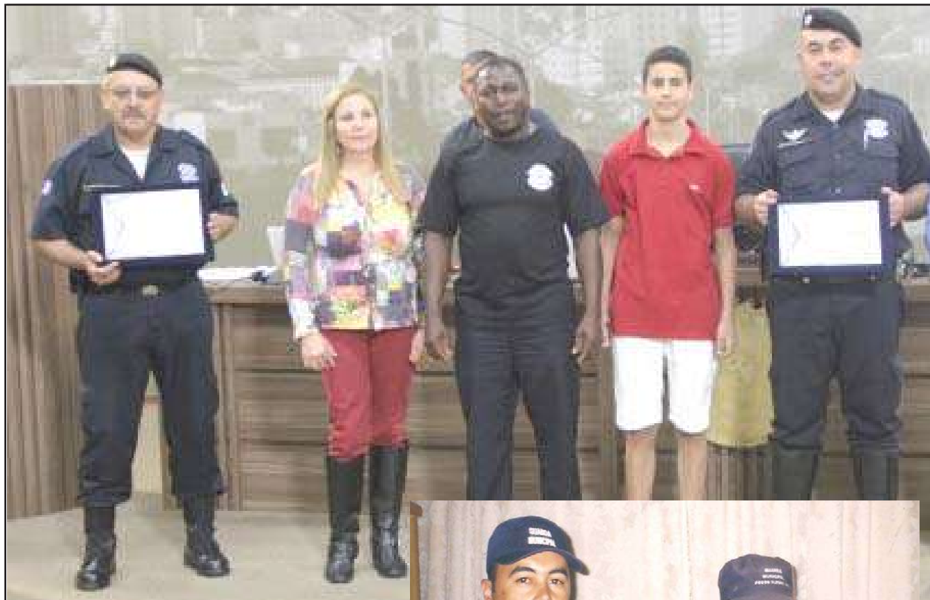
As imagens de um tempo em que a nossa guarda prestava relevantes serviços a comunidade.

À época, o sindicato que representa a categoria, o Sisempa , rebateu todos os argumentos, apontando que o município não enfrentava dificuldades financeiras e que ainda poderia ser beneficiado com verbas federais caso optasse por se adequar ao Estatuto das Guardas Municipais. Para o sindicato, o desejo real da Prefeitura era o de terceirizar o serviço, o que acabou acontecendo nos meses seguintes.